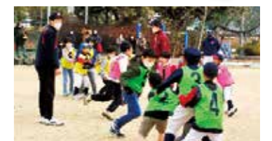
NPO法人西高松スポーツクラブと一緒に。