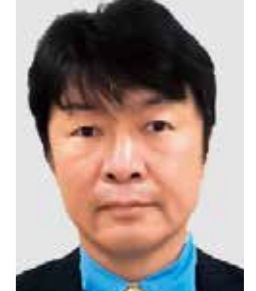
林田 豊 (ボクシング)