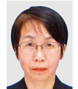
中 緑 (なぎなた)