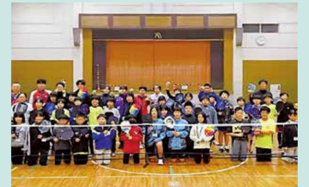
ピックルボール体験等(香川県青年センター)