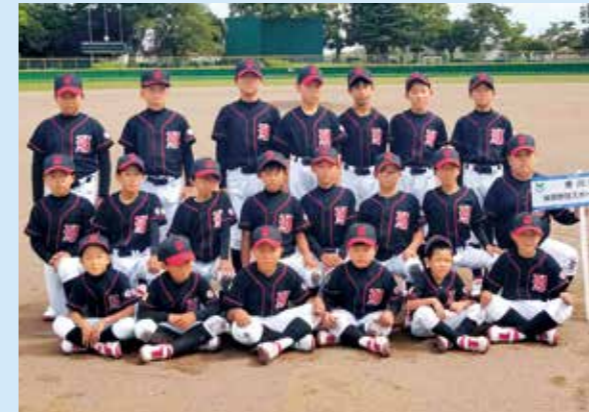
軟式野球(三重県):屋島野球スポーツ少年団