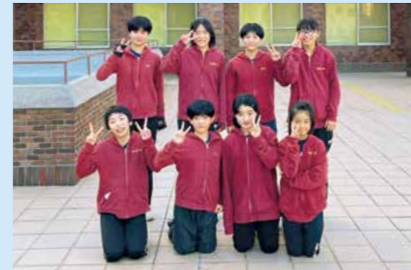
バレーボール(京都府)女子の部:丹生ジュニアバレーボールスポーツ少年団