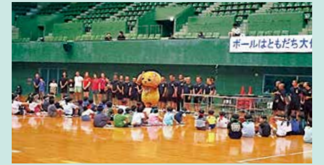
【受入】ドイツ団員とのスポーツ交流体験等(丸亀市・6ホストファミリー)